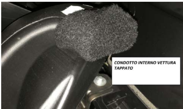
12-CONDOTTO INTERNO VETTURA ISOLATO