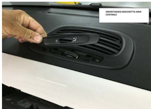
2-SMONTAGGIO BOCCHETTA ARIA CENTRALE