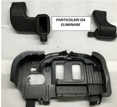
14-PARTICOLARI DA ELIMINARE