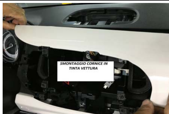
4-SMONTAGGIO CORNICE IN TINTA VETTURA