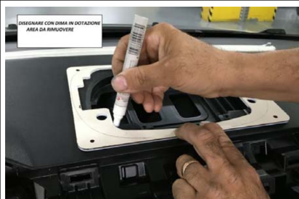
6-DISEGNARE CON DIMA IN DOTAZIONE AREA DA RIMUOVERE