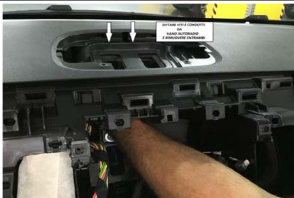
5-SVITARE VITI E CONDOTTI DA VANO AUTORADIO E RIMUOVERE ENTRAMBI