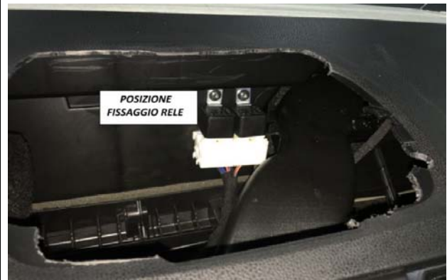
13-POSIZIONE FISSAGGIO RELE'