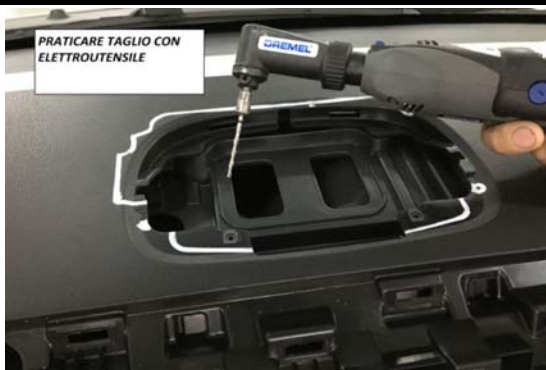
7-PRATICARE TAGLIO CON ELETTROUTENSILE COME QUELLO IN FIGURA