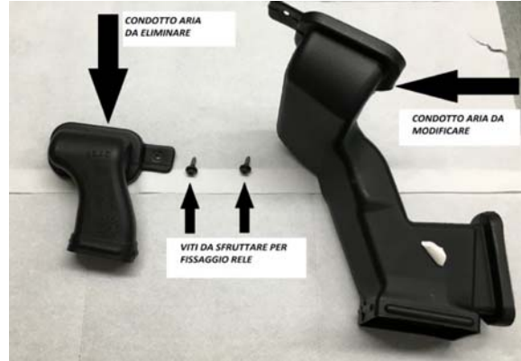
9-CONDOTTO ARIA DA ELIMINARE-CONDOTTO ARIA DA MODIFICARE-VITI DA SFRUTTARE PER FISSAGGIO RELE'