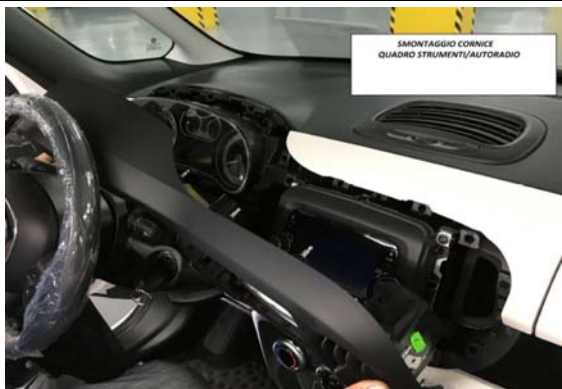
1-SMONTAGGIO CORNICE QUADRO STRUMENTI/AUTORADIO