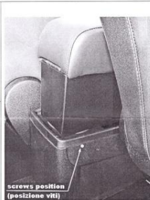
screws position (posizione viti)

SEGUIRE LE ISTRUZIONI INSERITE NELLA CONFEZIONE. FISSAGGIO CON 2 VITI.