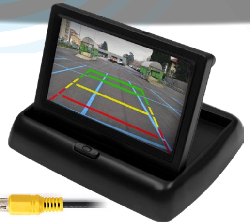
Sistema di collegamento video (monitor e retrocamera non inclusi nel kit)