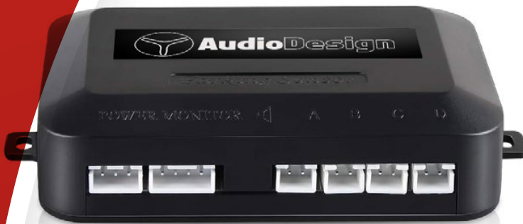
Unità di controllo