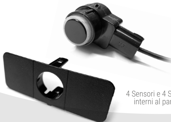
4 Sensori e 4 Supporti interni al paraurti